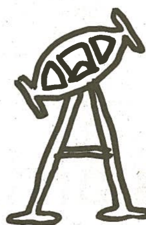
Zīmējums — Ernests Kļaviņš, Diena

tāji tikās ar A.Kalvīti pirms vēlēšanām.